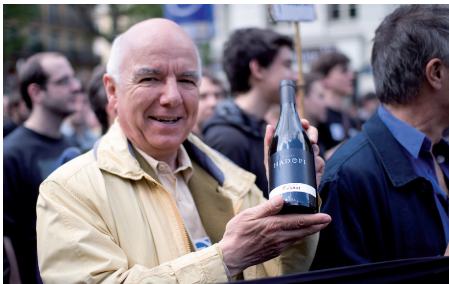
Jean-Pierre Brard, à la santé de Hadopi !