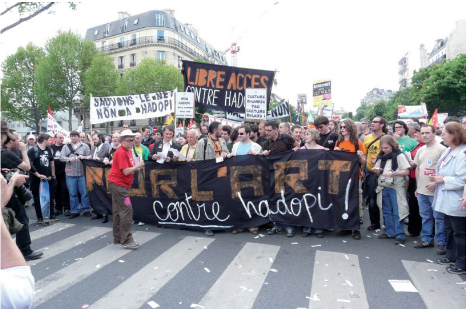
Une véritable réussite